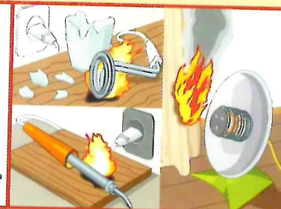
ОСТАВЛЕНИЕ БЕЗ ПРИСМОТРА ЭЛЕКТРОНАГРЕВАТЕЛЬНЫХ ПРИБОРОВ